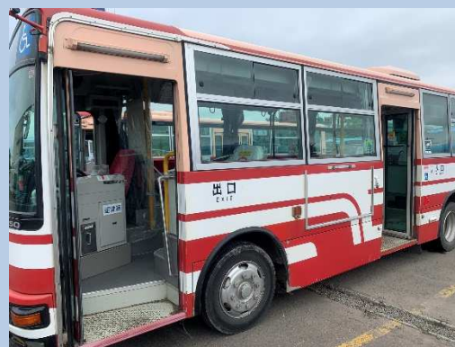
○停車時のドア開放等による 車内換気（適宜）