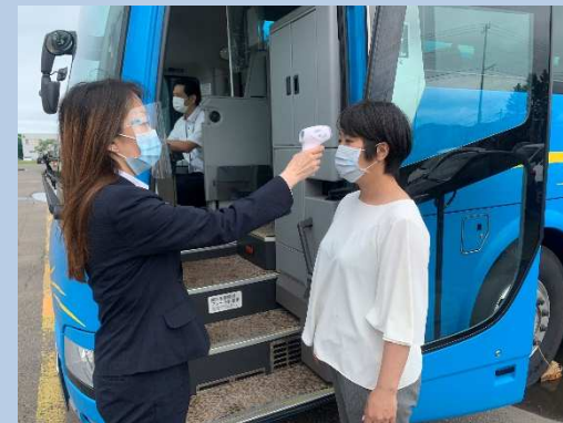
○お客様に対する 乗車時の体温チェック