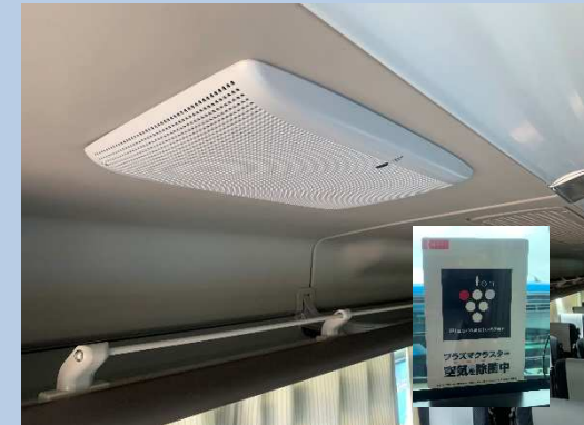
○プラズマクラスターによる 空気清浄(一部車両のみ)