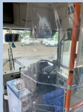
○飛沫感染防止シートの設置