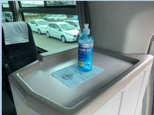
○手指用消毒液の設置