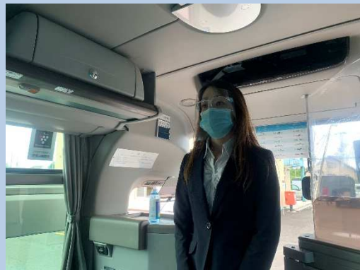
○バスガイド案内時の フェイスシールド着用 (状況に応じ、要相談)