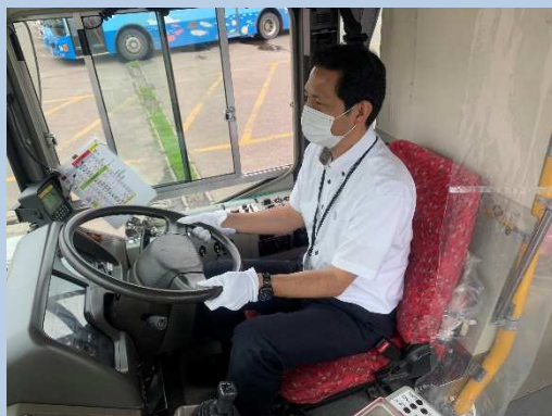
○点呼時の体温チェック 乗務中のマスク着用