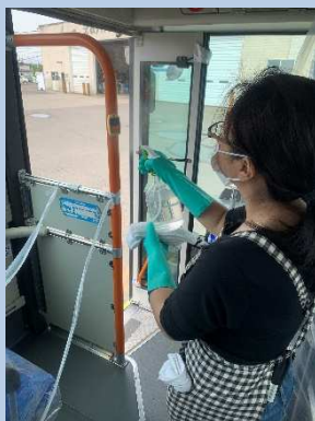
○車内清掃時の消毒（毎日実施）