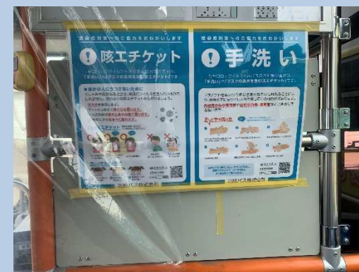
○車内での感染症対策の啓発活動